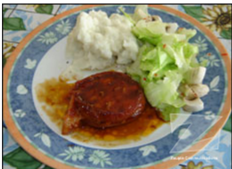
TOURNEDOS DE POULET AU SIROP D'ÉRABLE