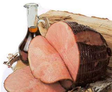
JAMBON À L'ÉRABLE